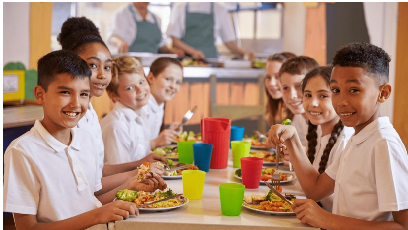
La nutrición también se aprende en la escuela.

La salud de una sociedad descansa en gran medida en lo que comemos. Cada bocado que tomamos es una oportunidad para fortalecer nuestra salud y bienestar, o para socavarlos. La nutrición es un pilar fundamental de la salud y va más allá de simplemente saciar el hambre. Hablamos de equilibrar los nutrientes que ingerimos para asegurar un estado óptimo de salud. En esta odisea nutricional, la malnutrición, ya sea por exceso o por defecto, es una poderosa fuerza que puede dictar el destino de una sociedad.